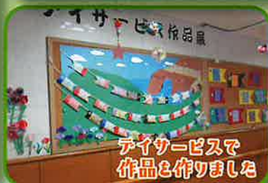
デイサービスで 作品と作りました