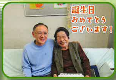
誕生日 おめでとう ございます!