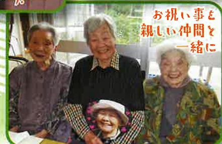
お祝い事と 親しい仲間と 一緒に