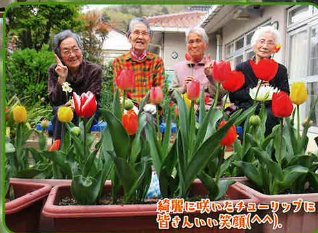
綺麗に咲いたチューリップに 皆さんいい笑顔(^^)。