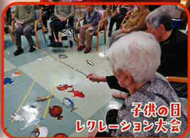
子供の目 レクリエーション大会