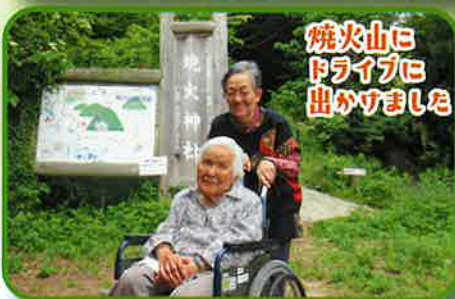
焼火山に ドライブに 出かけました