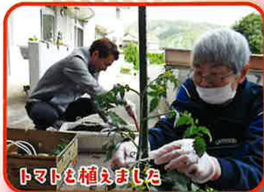
トマトも植えました