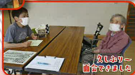
久しぶりー 面会できました