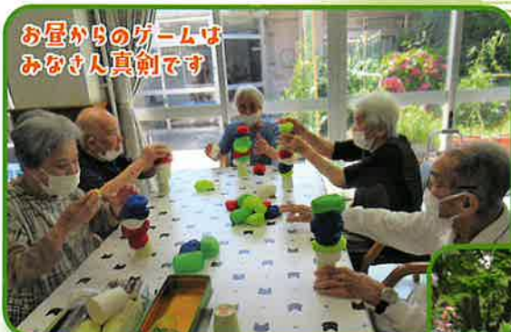
お昼からのゲームは みなさん真剣です