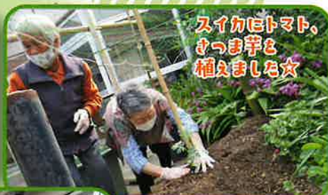
スイカビトマト、 さつま芋も 植えました☆